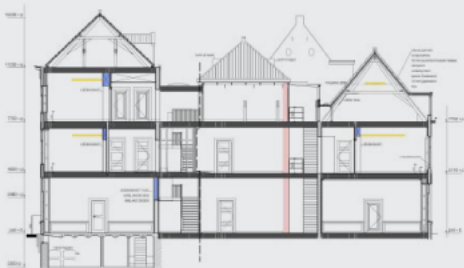
RENOOY 14e EEUW ±1575 ±1725 ±1860 ±1930 2007